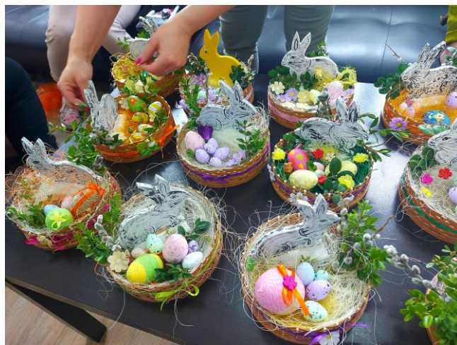
Stroiki wykonane przez uczestników ŚDS w Dźwierzutach

Podczas pobytu zapewnione jest wyżywienie, które często przygotowują sobie sami w ramach codziennego treningu kulinarnego. Trening ten odbywa się również poprzez wyjście z opiekunem po zakup produktów potrzebnych do wykonania treningu kulinarnego.