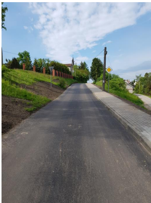
Ulica Kościelna w Dźwierzutach po modernizacji

W 2022 roku zmodernizowaliśmy ul. Kościelną w Dźwierzutach. Udało się to zrobić z dofinansowaniem z Rządowego Funduszu Inwestycji Lokalnych. Koszt wykonania inwestycji wyniósł 120 227,65 zł .