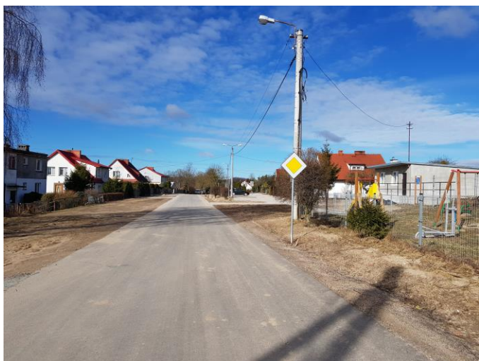
Widok na przebudowaną drogę w Stankowie

Ponadto wykonaliśmy przebudowę fragmentu drogi gminnej Nr 195036N w miejscowości Stankowo z udziałem środków Rządowego Funduszu Rozwoju Dróg (w kwocie 392 319,31 zł). Cała inwestycja kosztowała 792 243,35 zł . Ponadto dobudowano chodniki, które nie znalazły się w dokumentacji, a potrzeba ich wykonania zaszła tuż po oddaniu drogi do użytkowania. Na tą infrastrukturę wydaliśmy z budżetu gminy dodatkowe 22 169,08 zł .