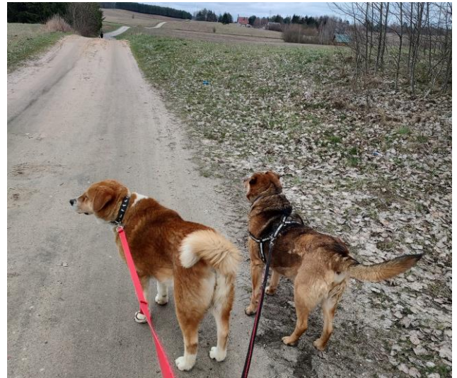
Psy z przytuliska podczas codziennego spaceru z Wolontariuszami

Na realizację Programu wydano łącznie 6 892,40 zł .