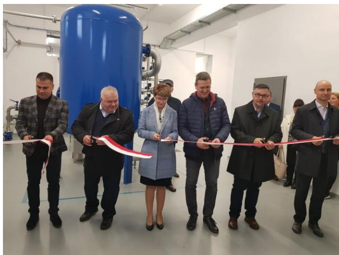
Spotkanie podsumowujące inwestycję na SUW Laurentowo

Budowa sieci wodociągowej i sieci kanalizacji sanitarnej w miejscowości Śledzie - etap I i II oraz przebudowa Stacji Uzdatniania Wody w Laurentowie to największa inwestycja wodno-kanalizacyjna realizowana w 2021 roku. Kwota jaką wydano na jej realizację wyniosła 3 086 421,07 zł , z czego 1 989 589,00 zł stanowiło dofinansowanie ze środków Unii Europejskiej w ramach Programu Rozwoju Obszarów Wiejskich na lata 2014-2020.