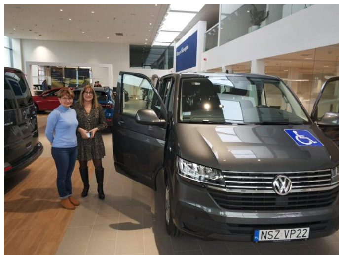
Wójt Gminy z Kierownikiem ŚDS w trakcie odbioru samochodu

Zadbaliśmy także o bezpieczeństwo podopiecznych Środowiskowego domu Samopomocy w Dźwierzutach i w dniu 9 stycznia odebraliśmy z salonu nowy, przystosowany do przewozu osób z niepełnosprawnościami samochód, na który gmina Dźwierzuty pozyskała dofinansowanie z PFRON.